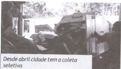
Desde abril cidade tem a coleta seletiva

Os moradores devem ficar atentos aos dias em que o caminhão