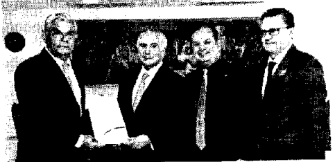
Governador fez diversas solicitações ao governo federal